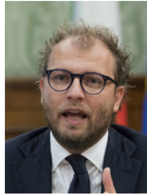
LUCA LOTTI Ministro per lo Sport

Toscano, appassionato di calcio e non solo, Luca Lotti dal 12 dicembre 2016 riveste il ruolo di ministro per lo Sport. Tra gli obiettivi del suo mandato occupa un ruolo centrale la promozione della cultura sportiva quale preziosa risorsa per il nostro Paese e per i nostri giovani.